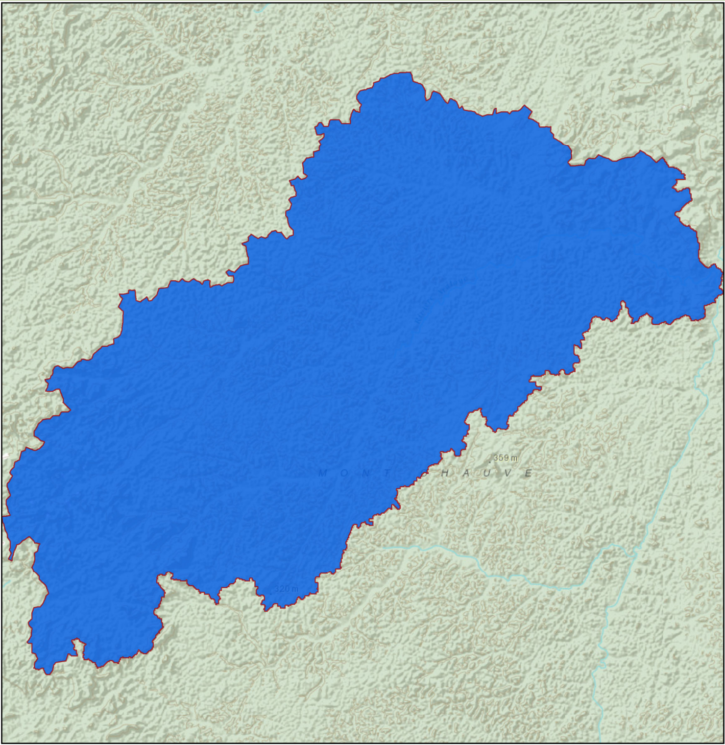
Représentation de l'entité