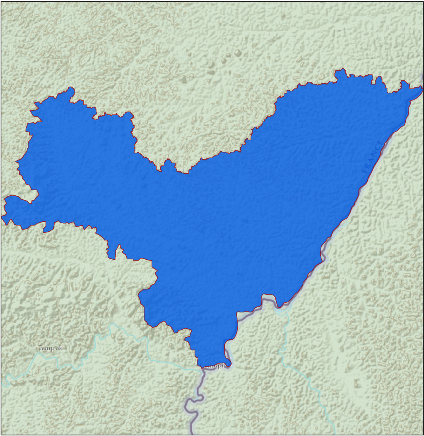
Représentation de l'entité