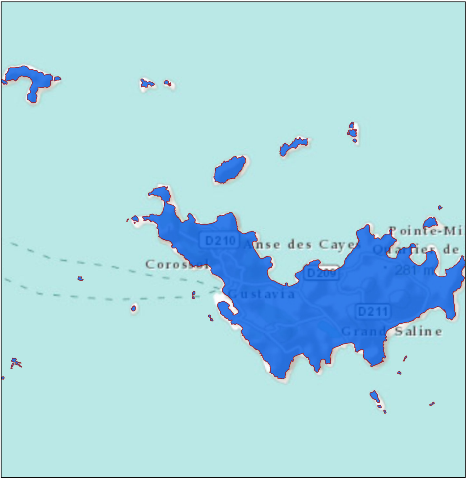
Représentation de l'entité