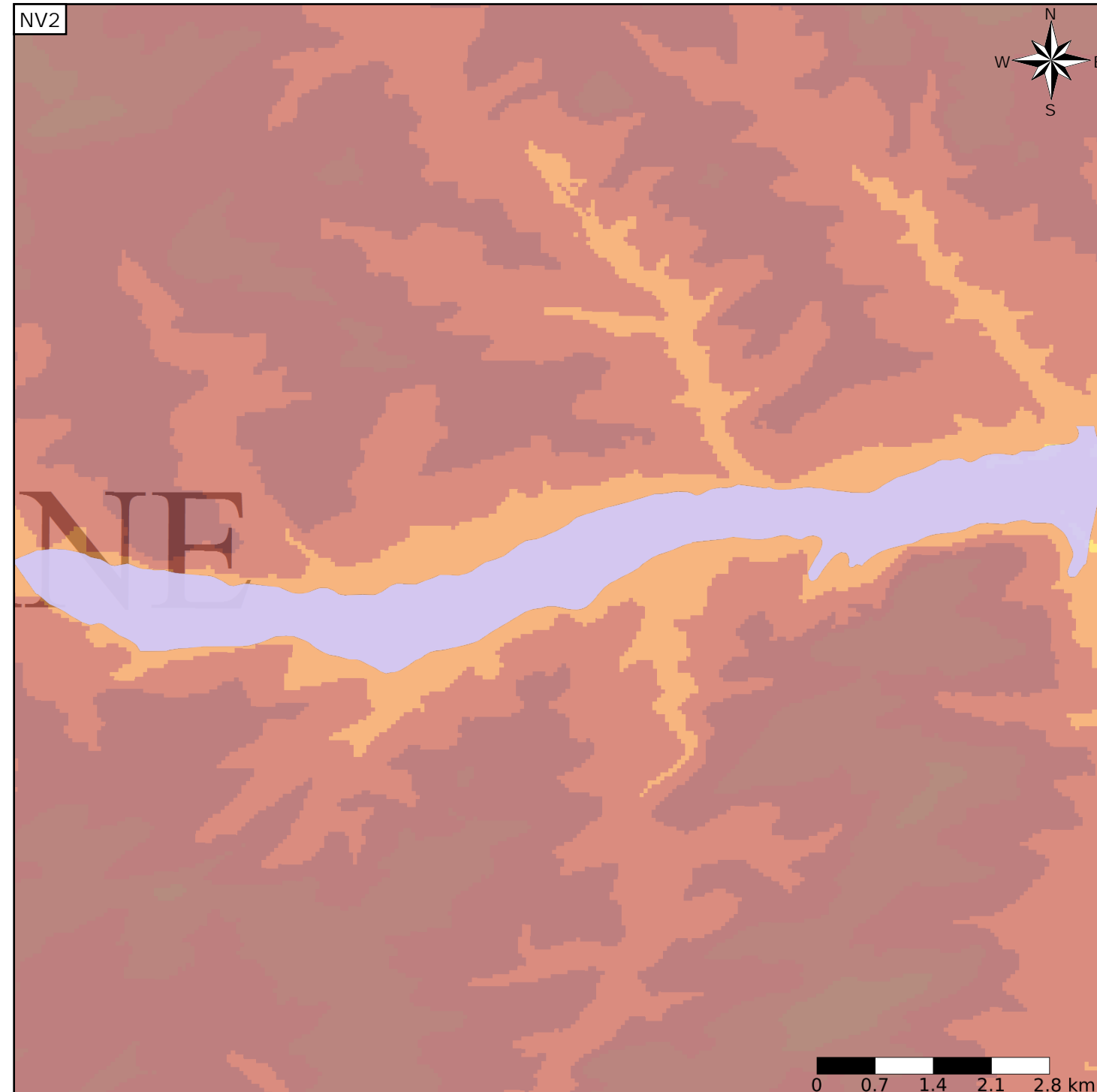
Représentation de l'entité

Type de modification : Création pure de l'entité qui n'existait pas dans la VO